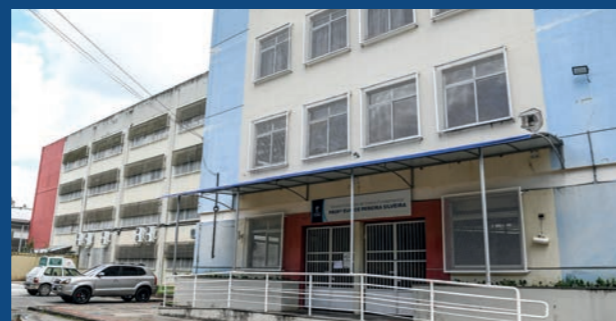
6. Reforma e instalações elétricas da Emef Professora Eunice Pereira da Silva - Tabuazeiro (Em execução)