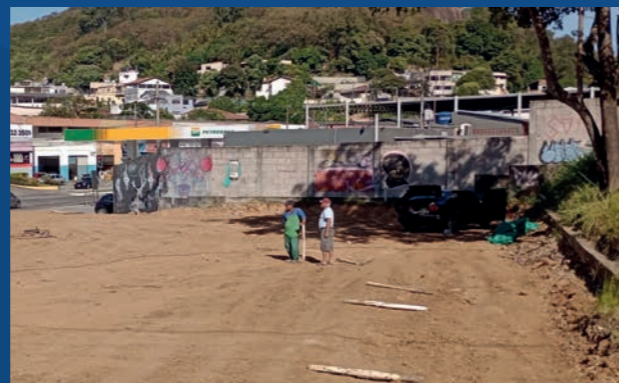
17. Construção do Campo de Grama Sintética de Tabuazeiro (Em execução)