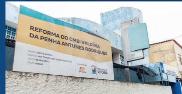
9. Reforma do Cmei Valdívia da Penha - Santos Dumont (Concluída)