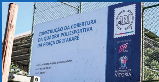
2. Cobertura da quadra de Itararé (Em execução)