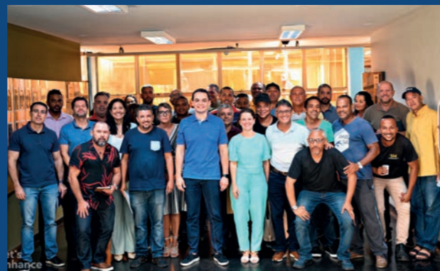
18. Encontro da Regional com a PMV