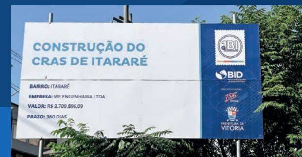
16. Construção do Cras de Itararé (Em execução)