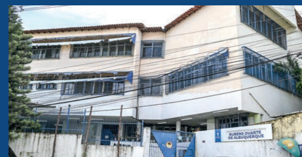
11. Reforma do Cmei Rubens Duarte de Albuquerque - Itararé (Em execução)