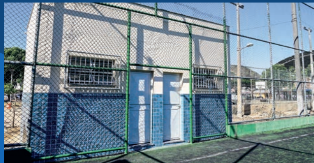
1. Construção do vestiário no campo da Praça de Itararé (Concluída)