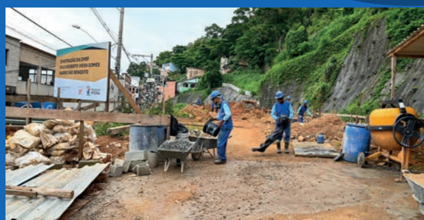
3. Construção da Emef Paulo Roberto Vieira Gomes - São Benedito (Em execução)