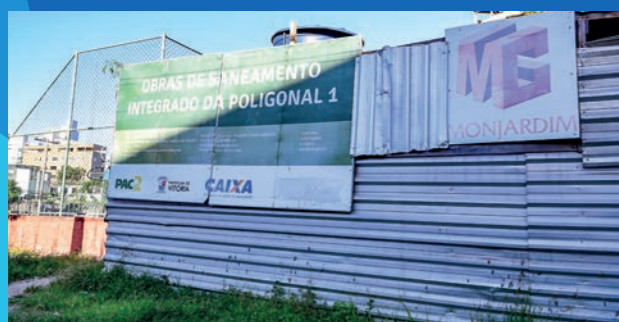
4. Obras de saneamento integrado na Poligonal 1 (Em execução)