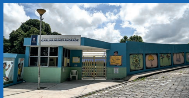
8. Reforma do Cmei Ocarlina Nunes Andrade - Joana D'arc (Concluída)