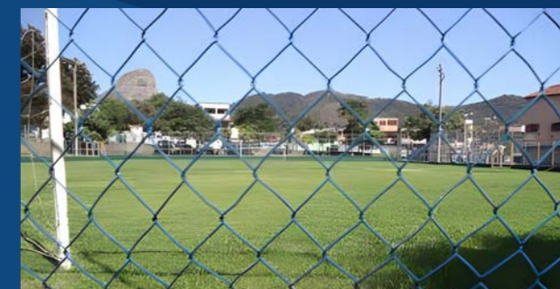
14. Reforma geral no CEL de Eucalipto (Em execução)