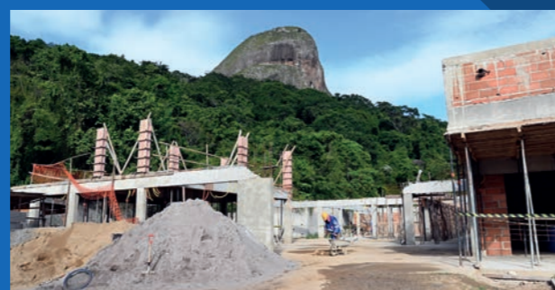
7. Construção do Cmei Jacy Alves Fraga - Tabuazeiro (Em execução)