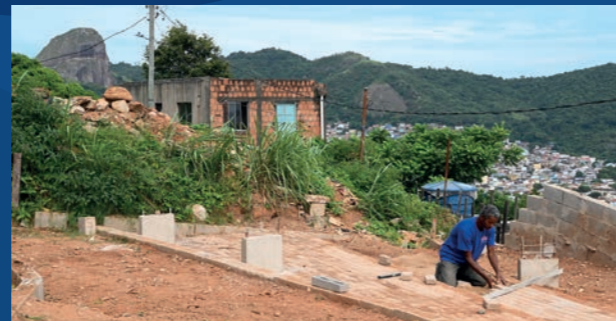
5. Quadra no bairro Da Penha (Em execução)