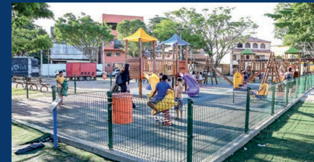
13. Parque Kids na Praça de Itararé (Concluída)